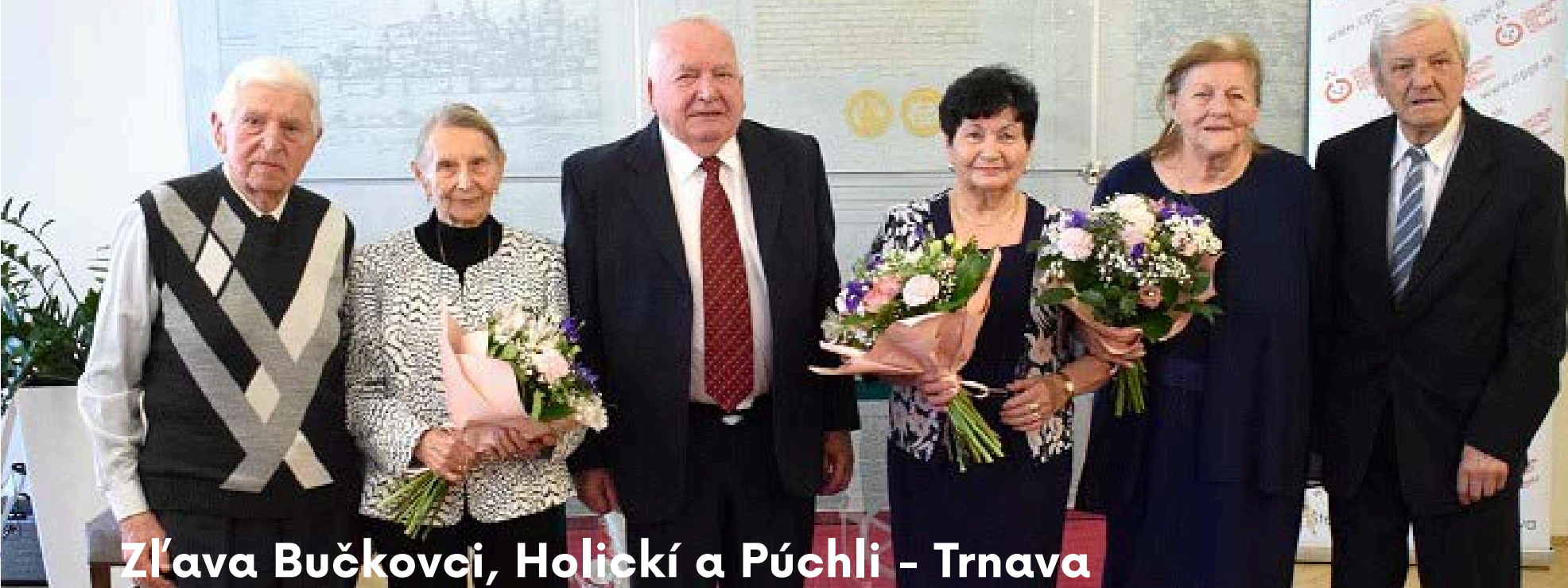
Zl'ava Bučkovci, Holickí a Púchli - Trnava